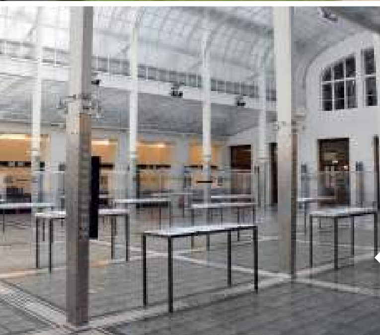
Lokettenzaal Postsparkasse, met glazen vloer