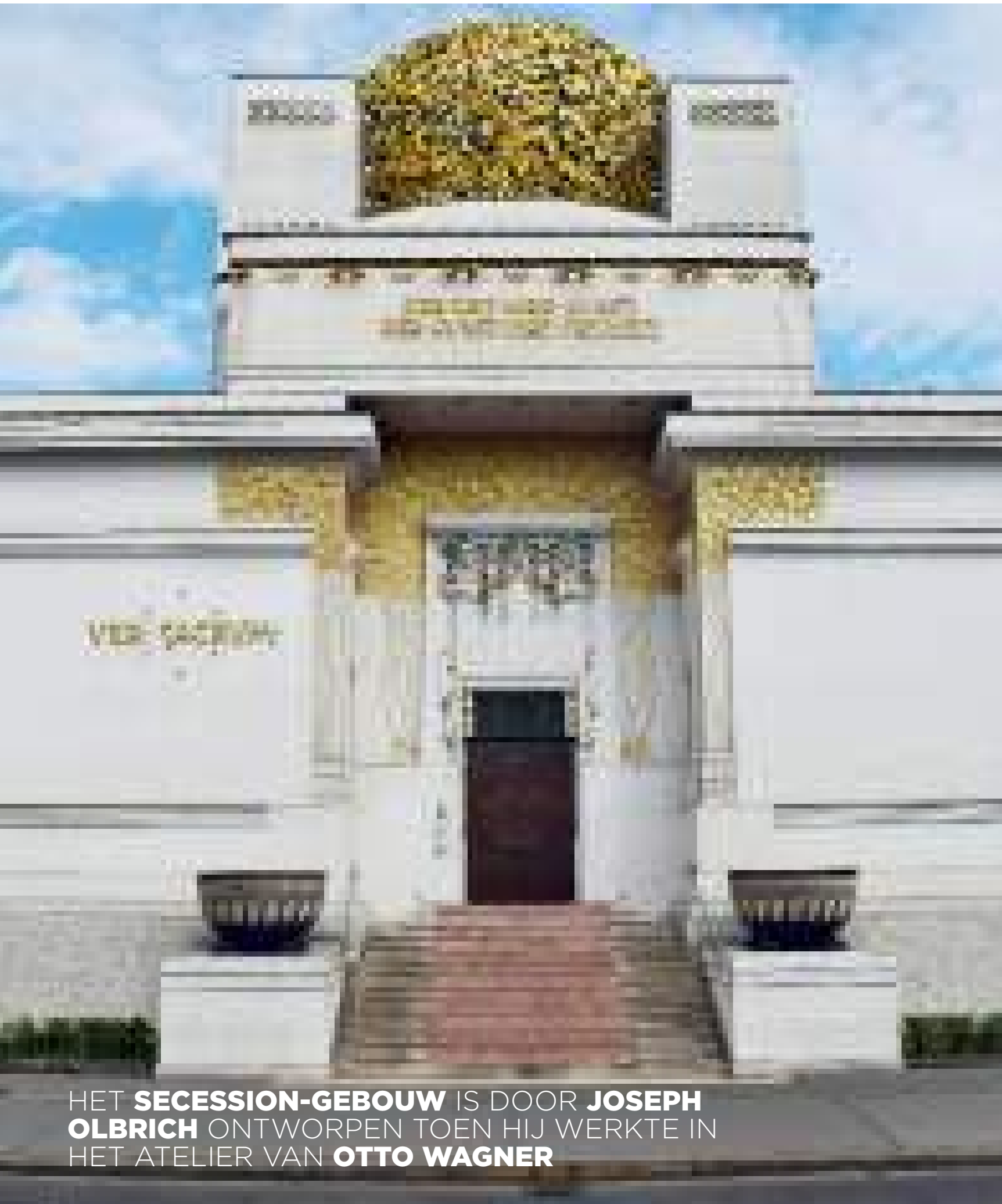
HET SECESSION-GEBOUW IS DOOR JOSEPH OLBRICH ONTWORPEN TOEN HIJ WERKTE IN HET ATELIER VAN OTTO WAGNER

‘OTTO WAGNER WAS ER DE MAN NIET NAAR OM VERBITTERD TE RAKEN. DAARVOOR HAD HIJ TE VEEL SUCCES EN EEN ERG HOGE DUNK VAN ZICHZELF’