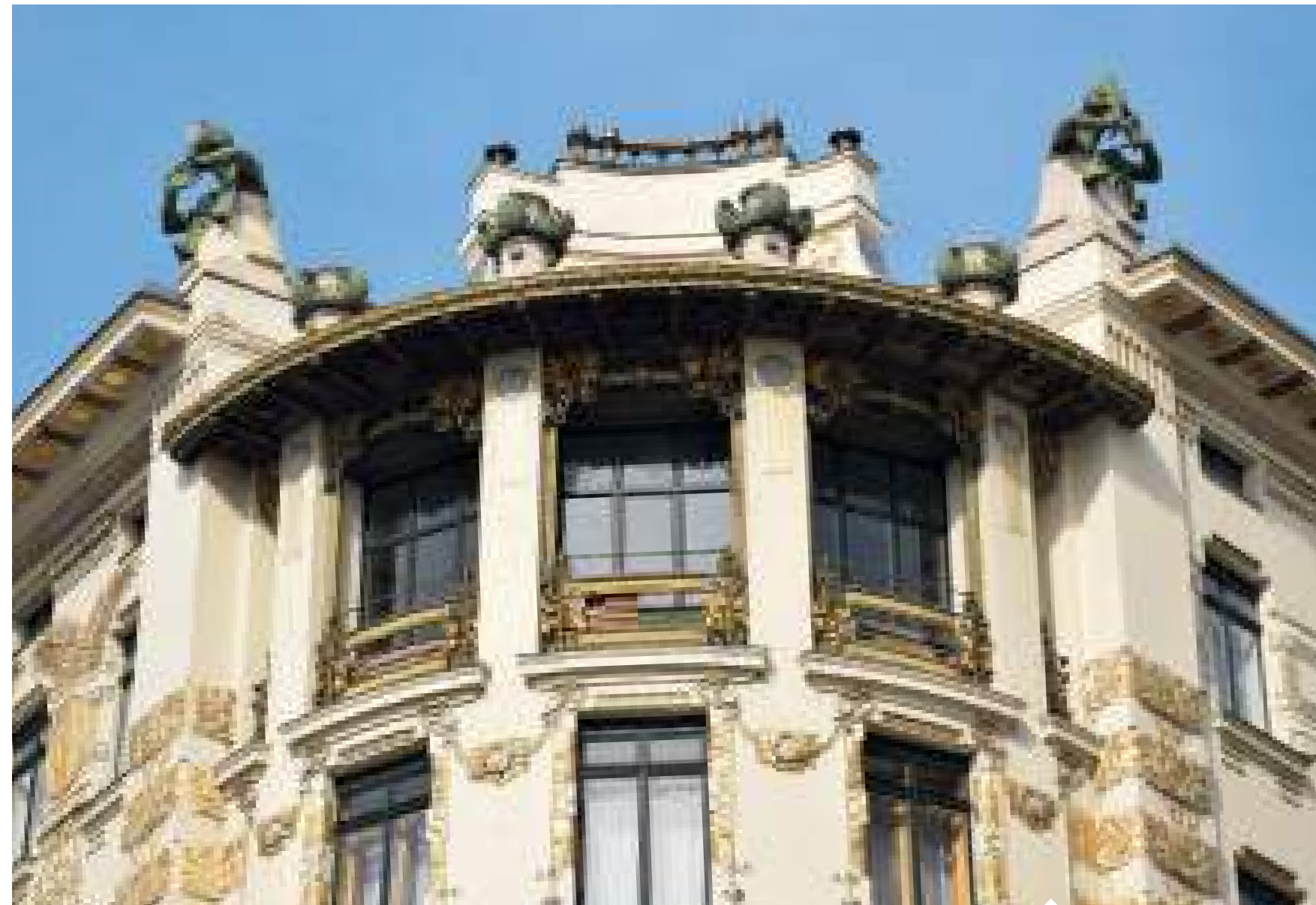
Rechts en boven: het 'gouden huis' aan de Wienzeile 38

Vanaf 1900 worden Wagners ontwerpen soberder. Dat komt bijvoorbeeld tot uiting in zijn